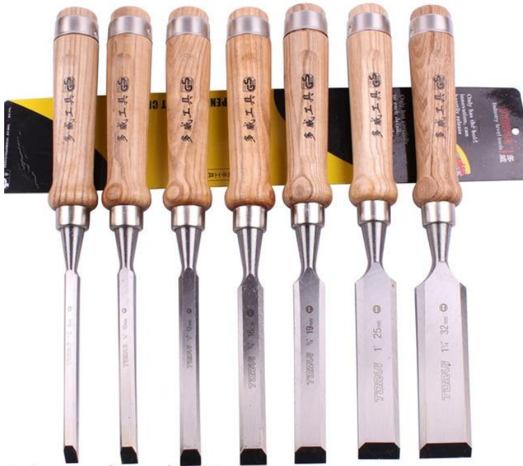
7pcs chisel kits

الإزميل ، وهو عبارة عن أداة معدنيّة مصنوعة من الحديد، وهو متوافر بأحجام متعدّدة منها الصغير ومنها ما هو مدبّب الرأس، ويستخدم للحفر على الخشب.