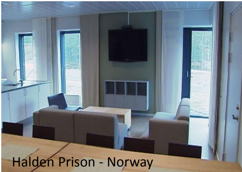
Halden Prison - Norway

إذ يقول: ﴿أَلَا يَعْلَمُ مَنْ خَلَقَ وَهُوَ اللَّطِيفُ الْخَبِيرُ﴾ (الملك: ١٤)